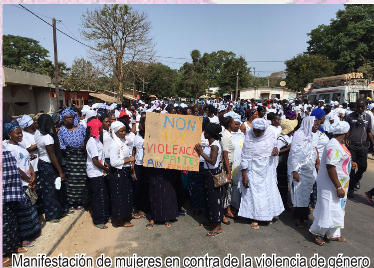
Manifestación de mujeres en contra de la violencia de género

Trabajar con el fin de alcanzar la igualdad de género y autonomía de las mujeres es una de nuestras prioridades y una cuestión que atraviesa todos nuestro proyectos, empezando por los dedicados a la infancia y juventud .